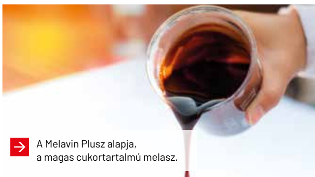
➔ A Melavin Plusz alapja, a magas cukortartalmú melasz.

A Melavin Plusz a melasz-vinasz keveréke, amely nitrogénnel és mikroelemekkel van kiegészítve. Elsődleges feladata a több éves száraz bontása, a talajélet visszaállítása. Ezért a Melavin Plusz nagyon magas cukor- és nitrogéntartalmú termék, amely mint egy energiatartaléka, azonnal felpörgeti a talaj élőlényeit. A hazai talajok kiürültek cinkből, ezért ebből az elemből jelentős mennyiséget tartalmaz.