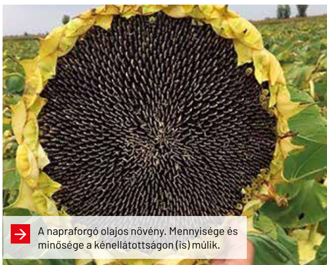
→ A napraforgó olajos növény. Mennyisége és minősége a kénellátottságon (is) múlik.