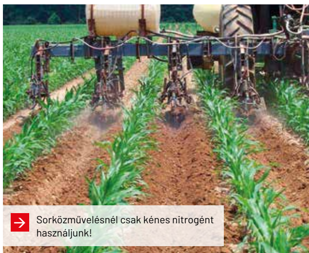
→ Sorközművelésnél csak kénes nitrogént használjunk!

Az ammónium-tioszulfát (ATS) nagyon magas nitrogén-kén hatóanyag-tartalmú folyékony koncentrátum. Ilyen termék például a Vulcan Profi S35MoB, amely a kén és nitrogén mellett bórt és molibdént is tartalmaz. Használhatjuk nagyobb mennyiségben, mint talajtrágya és kis-közepes mennyiségben lombtrágyaként. A tioszulfátokkal nagy mennyiségben tudunk olcsón kén és nitrogént pótolni, amelyet a növények gyorsan tudnak hasznosítani.