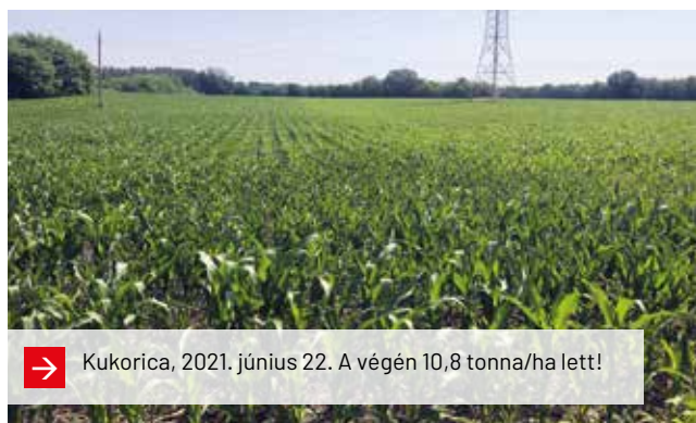
→ Kukorica, 2021. június 22. A végén 10,8 tonna/ha lett!

A folyékony NPK-t vagy Turbó PK-t kijuttathatjuk már ősszel, de akár a vetés előtt közvetlenül is. Lehetőleg a szármagadványokra kerüljön, mivel gyorsítja azok bomlását és tápanyaggá alakulását. Vetéssel egy menetben is használhatjuk, bár ekkor már koncentráltabb és kisebb dózisú terméket javasolunk.