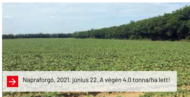
→ Napraforgó, 2021. június 22. A végén 4,0 tonna/ha lett!