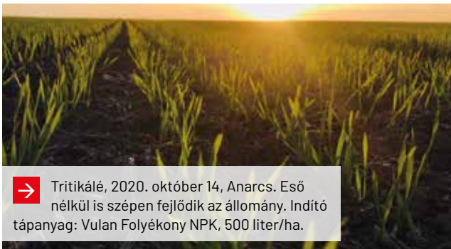
→ Tritikálé, 2020. október 14, Anarcs. Eső nélkül is szépen fejlődik az állomány. Indító tápanyag: Vulcan Folyékony NPK, 500 liter/ha.

A folyékony NPK-t vagy Turbó PK-t kijuttathatjuk már ősszel, de akár a vetés előtt közvetlenül is. Lehetőleg a szármadarványokra kerüljön, mivel gyorsítja azok bom-