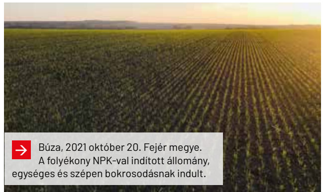
→ Búza, 2021 október 20. Fejér megye. A folyékony NPK-val indított állomány, egységes és szépen bokrosodásnak indult.

lását és tápanyaggá alakulását. Vetéssel egy menetben is használhatjuk, bár ekkor már koncentráltabb és kisebb dózisu terméket javasolunk.